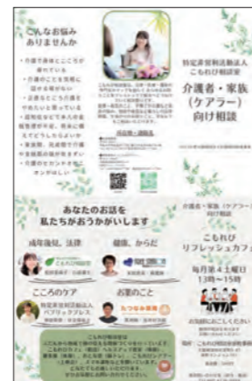
カフェは様々な相談に対応できるようにするため専門職4名体制にした