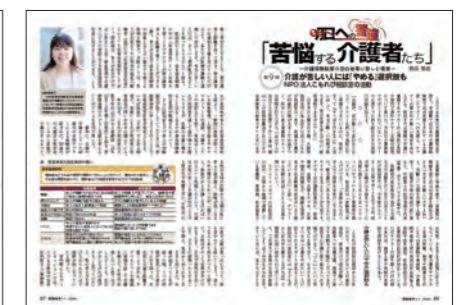
医療専門誌「医療経済」の取材を受け、1月1日号に3ページの特集として掲載