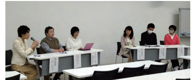
地域の専門職でケアラー支援についてディスカッションを行った