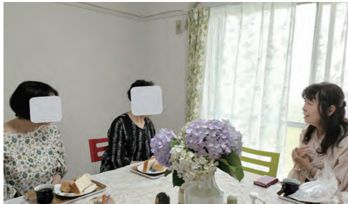
ケアラーに足を運んでいただきやすいようにカフェ形式の相談の場を開催