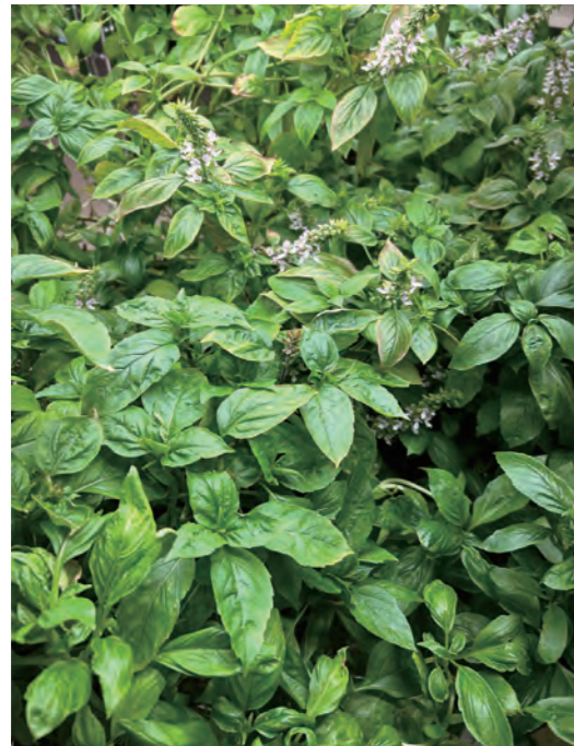
水耕栽培で作った生命力あふれるバジルの葉