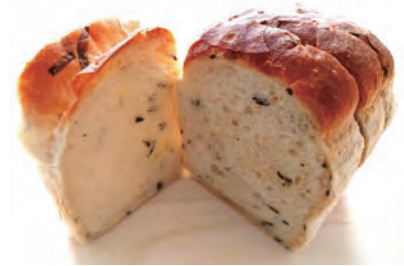
できあがったパン

の会議を行った。その結果、バジルを用いたバジルパンの生産を行うことにし、市内での販売を開始した。