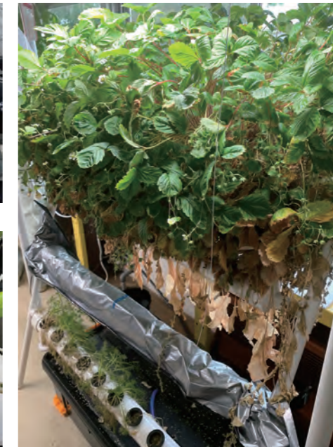
収穫を待つバジルプラント